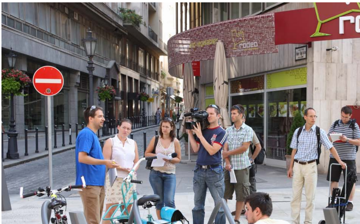
Audit sur la pratique de la marche à Budapest

Convention de subvention IEE/08/566/S12.528405 – ACTIVE ACCESS