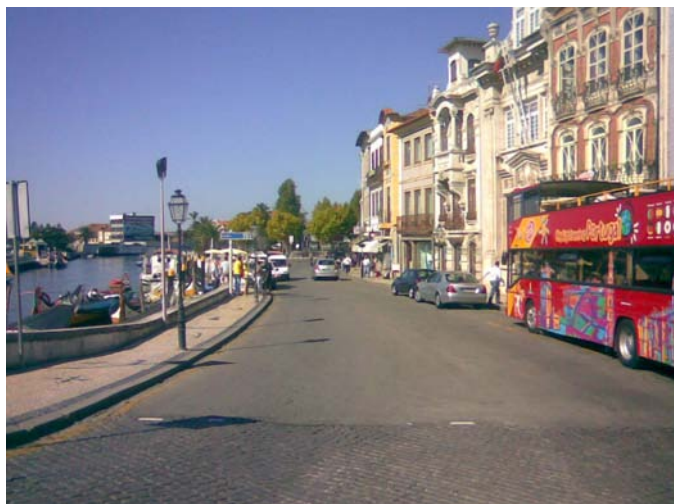
Document 4.3. Photo prise lors de l'audit à Aveiro (Portugal) montrant l'étroitesse des trottoirs –une des zones mises en évidence pour améliorer l'environnement des piétons