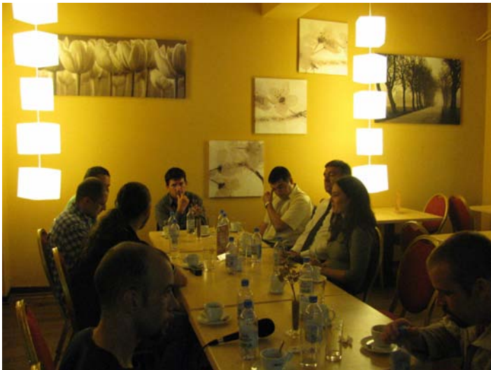
Document 4.5 Les parties prenantes en table ronde à la suite de l'audit dans Miercurea Ciuc (Roumanie)