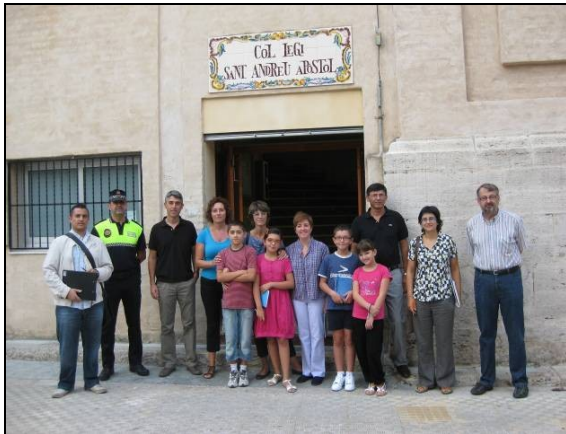
Document 4.2. Les participants de l'un des 5 audits menés par AER. Cet audit était concentré autour de l'école de Sant Andreu à l'Alcudia, Espagne