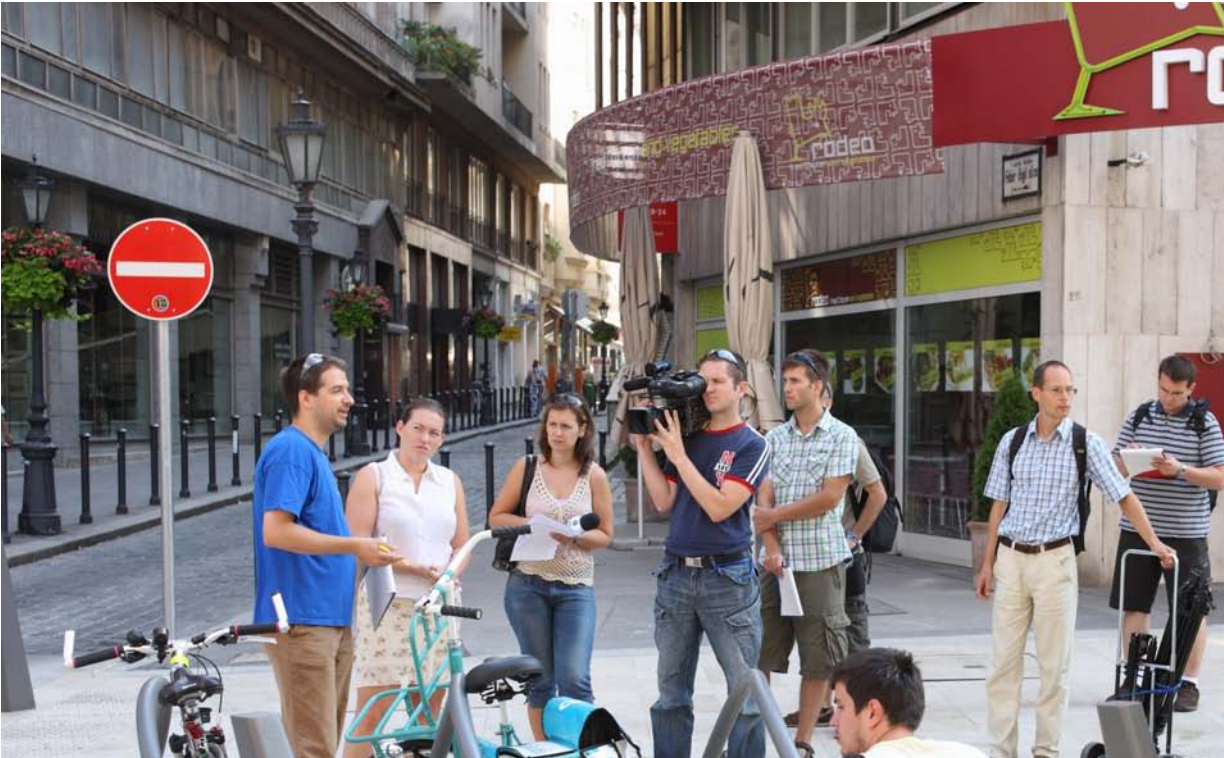
FGM AMOR – Walking Audit (Έλεγχος Ποιότητας Πεζής Μετακίνησης) στη Βουδαπέστη

Αριθμός Συμβολαίου IEE/08/566/S12.528405 – ACTIVE ACCESS