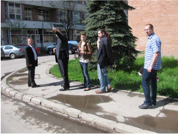
Εικόνα 4.4 Έλεγχος ποιότητας πεζής μετακίνησης (Walking audit) σε εξέλιξη στην πόλη Miercurea Ciuc, Ρουμανία (πραγματοποιήθηκε από HEMPS)