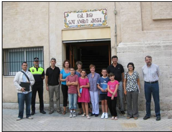
Εικόνα 4.2 Συμμετέχοντες σε 1 από τους 5 ελέγχους ποιότητας πεζής μετακίνησης (walking audits) που πραγματοποιήθηκαν από τον οργανισμό AER. Αυτός ο έλεγχος επικεντρώθηκε γύρω από το σχολείο Sant Andreu στην I'Alcudia, Ισπανία