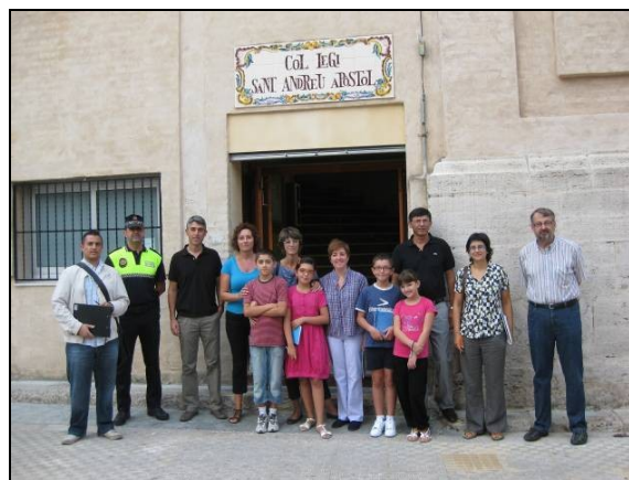
Slika 4.2 sudionici jednog od pet pješačkih audita koje je proveo AER.vaj audit u središtu zanimanja imao je školu SantAndreu u l'Alcudiji, Španjolska