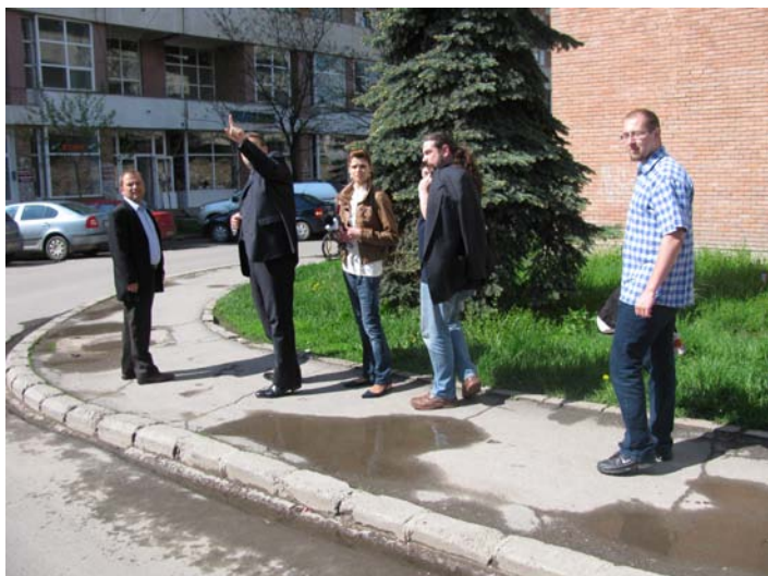
4.4. ábra A HEMPS által szervezett gyalogos bejárás Csíkszereda - Miercurea Ciuc, Románia