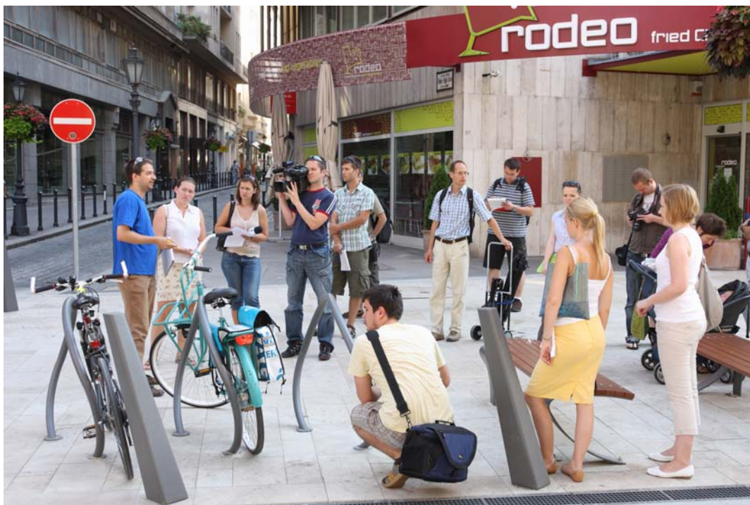
Gyalogos és kerékpáros bejárás Budapesten