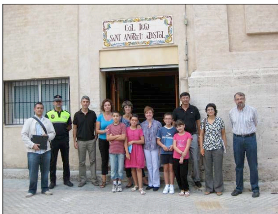
Figura 4.2 Participanții la unul dintre cele 5 audituri realizate de către AER. Acest audit a fost centrat asupra ariei școlii Sant Andreu în l'Alcudia, Spania.