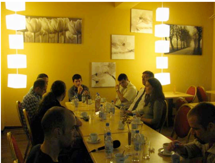
Figura 4.5 Masă rotundă organizată cu actorii locali după auditul mersului pe jos în Miercurea-Ciuc, România.