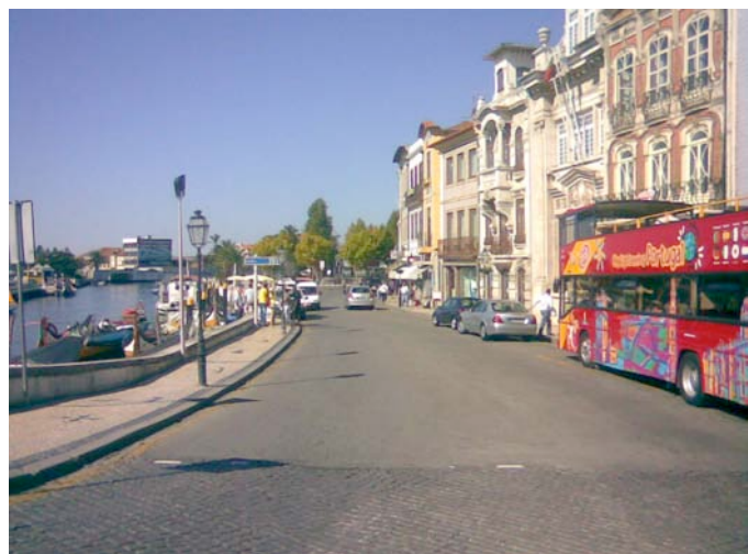
Figure 4.3 Imagine realizată în timpul auditului din Aveiro, Portugalia care arată îngustimea trotuarelor – una dintre ariile evidențiate pentru acțiune în vederea îmbunătățirii mediului pietonal