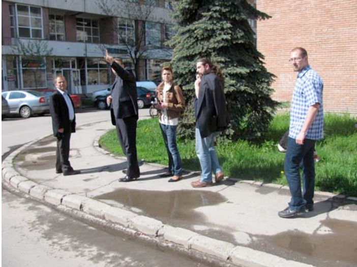
Figura 4.4 Audit al mersului pe jos în desfășurare în Miercurea-Ciuc, România (realizat de HEMPS)